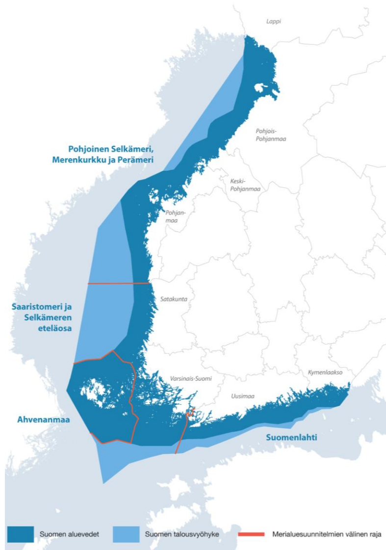
Kuva 1 Suomen merialuesuunnittelualueet

Merialuesuunnitelma laaditaan aluevesille ja talousvyöhykkeelle. Merialuesuunnitelman laatimisesta ja hyväksymisestä vastaavat ne maakuntien liitot, joiden alueeseen kuuluu aluevesiä. Maakuntien liittojen tulee valmistella merialuesuunnitelma yhteistyössä. Merialuesuunnitelmat on sovittava yhteen.