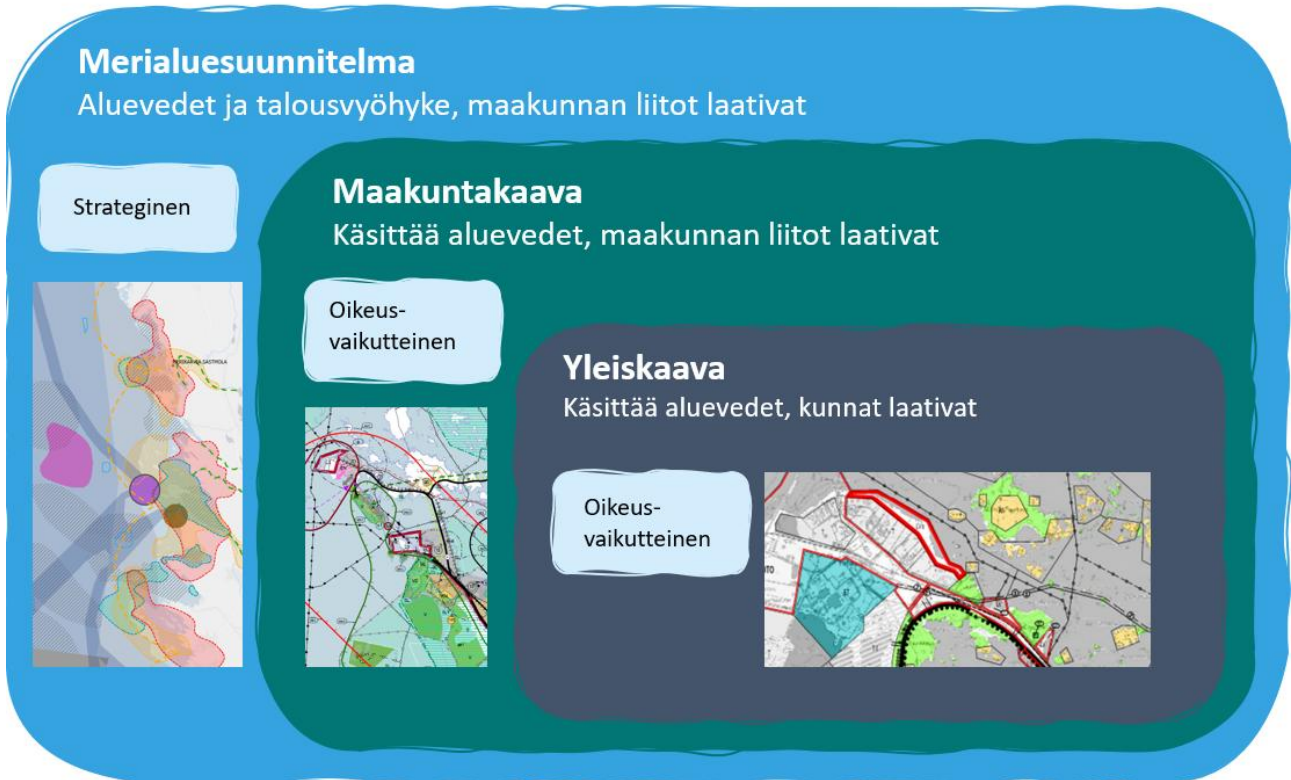
Kuva 3 Merialuesuunnitelma, maakuntakaava ja yleiskaava.

aluekehityshankkeita sekä luonnonvarasuunnitelmia ja merialueen hoito- ja käyttösuunnitelmia.